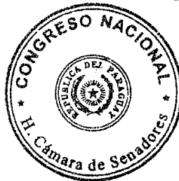
Roberto Acevedo Quevedo Presidente H. Cámara de Senadores